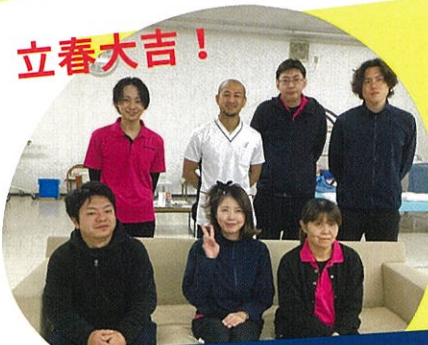
はまりハDayスタジオ大平