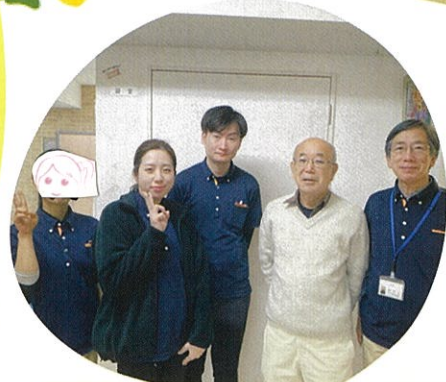
はまりハDayスタジオ青葉

元気と笑顔がもっとー!! これからも笑顔溢れるデイサービスで 一緒にリハビリ頑張りましょう!!